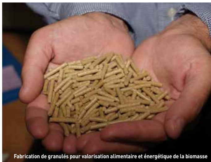
Fabrication de granulés pour valorisation alimentaire et énergétique de la biomasse

Contact : Pascal Jay - 02 38 78 19 61 - pascal.jay@afnor.org