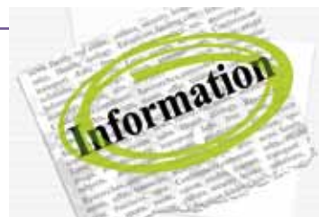
L'intelligence économique passe par de la veille et une recherche de l'information stratégique pour les entreprises.

Cette action soutient la création, au sein de l'ARITT, d'une cellule « d'intelligence économique » (défense et maîtrise de l'information stratégique des entreprises). L'ARITT apporte aux PME/PMI et aux pôles régionaux des méthodologies et des outils de gestion de l'information au service de deux missions : soutenir la réflexion stratégique et participer à l'émergence de l'innovation.