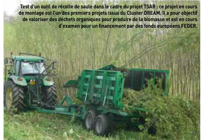
Test d'un outil de récolte de saule dans le cadre du projet TSAR : ce projet en cours de montage est l'un des premiers projets issus du Cluster DREAM. Il a pour objectif de valoriser des déchets organiques pour produire de la biomasse et est en cours d'examen pour un financement par des fonds européens FEDER.

Contact : Denis Groeninck - 02 38 69 80 59 denis.groeninck@tech-orleans.fr